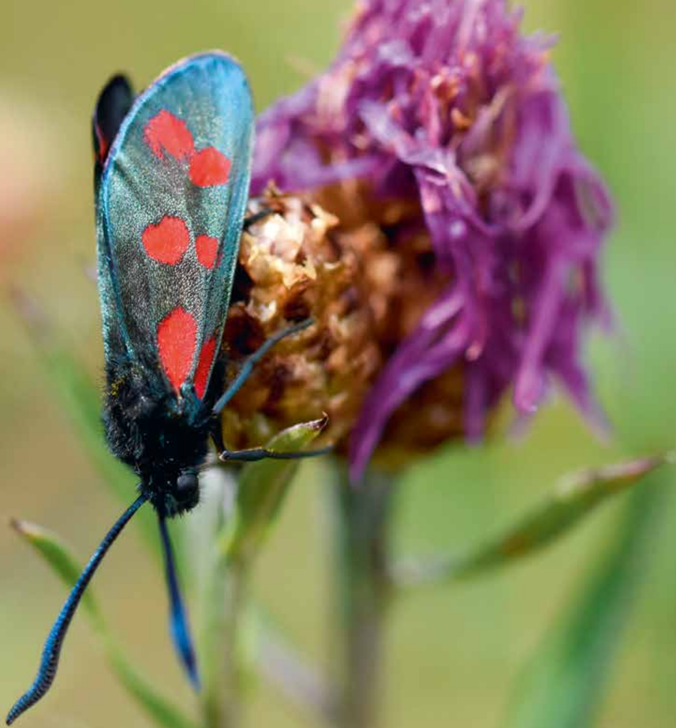
Åbo. Sexfläckig bastardsvärmare. ”Jag lyckades fotografera den mycket stiliga fjärilen, som utsöndrar en cyanidhaltig vätska. Dess utbredning koncentreras till Sydvästra Finland.”