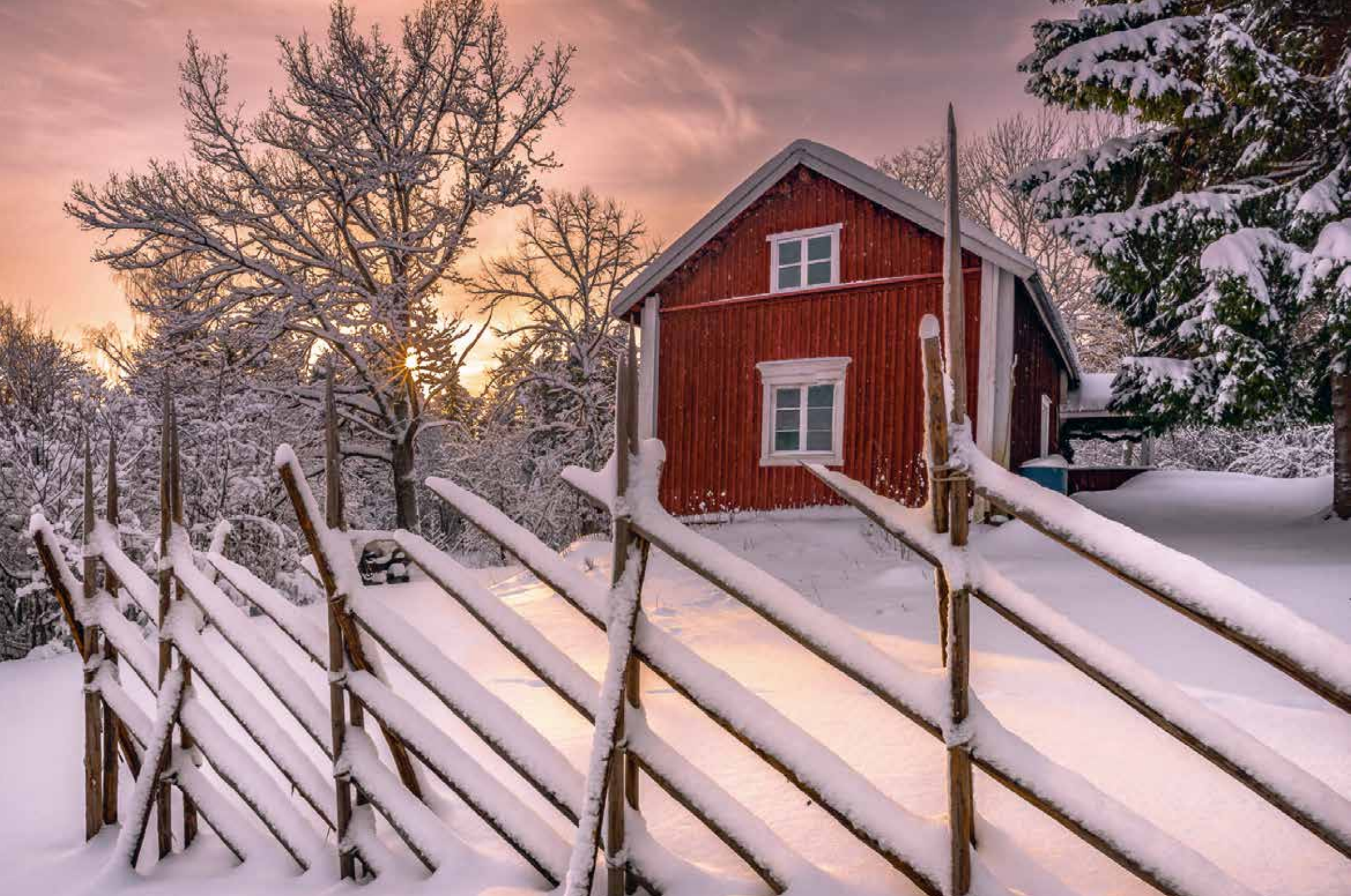
Hirvensalo, Åbo. Eftermiddagens ljus. ”Jag var på väg hem från pimpelfisket när jag lade märke till huset i fråga och det fina ljuset. Som tur är, så har jag nästan alltid kameran med mig.”