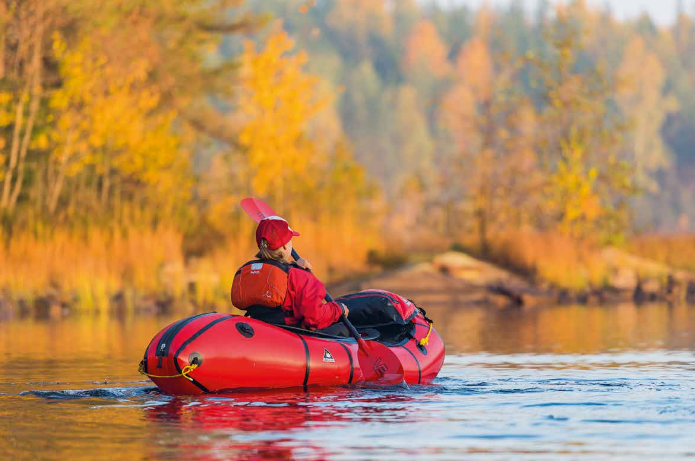
Matildanjärvi, Tykö nationalpark, Salo. Ut och paddla. "Vi var på packraft-utfärd. Det var ett mycket varmt veckoslut med tanke på årstiden, och höstfärgerna var imponerande."