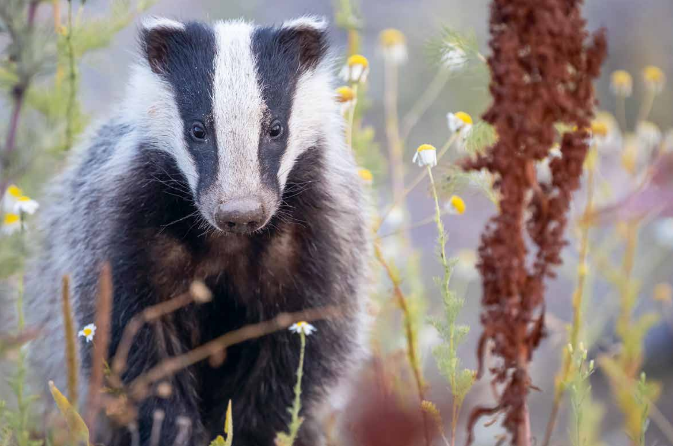
Åbo. Ett ofattbart möte. ”Jag vandrar mycket i naturen och har länge drömt om att möta en grävling. Under min kvällspromenad sprang det plötsligt tre stycken i benen på mig!”