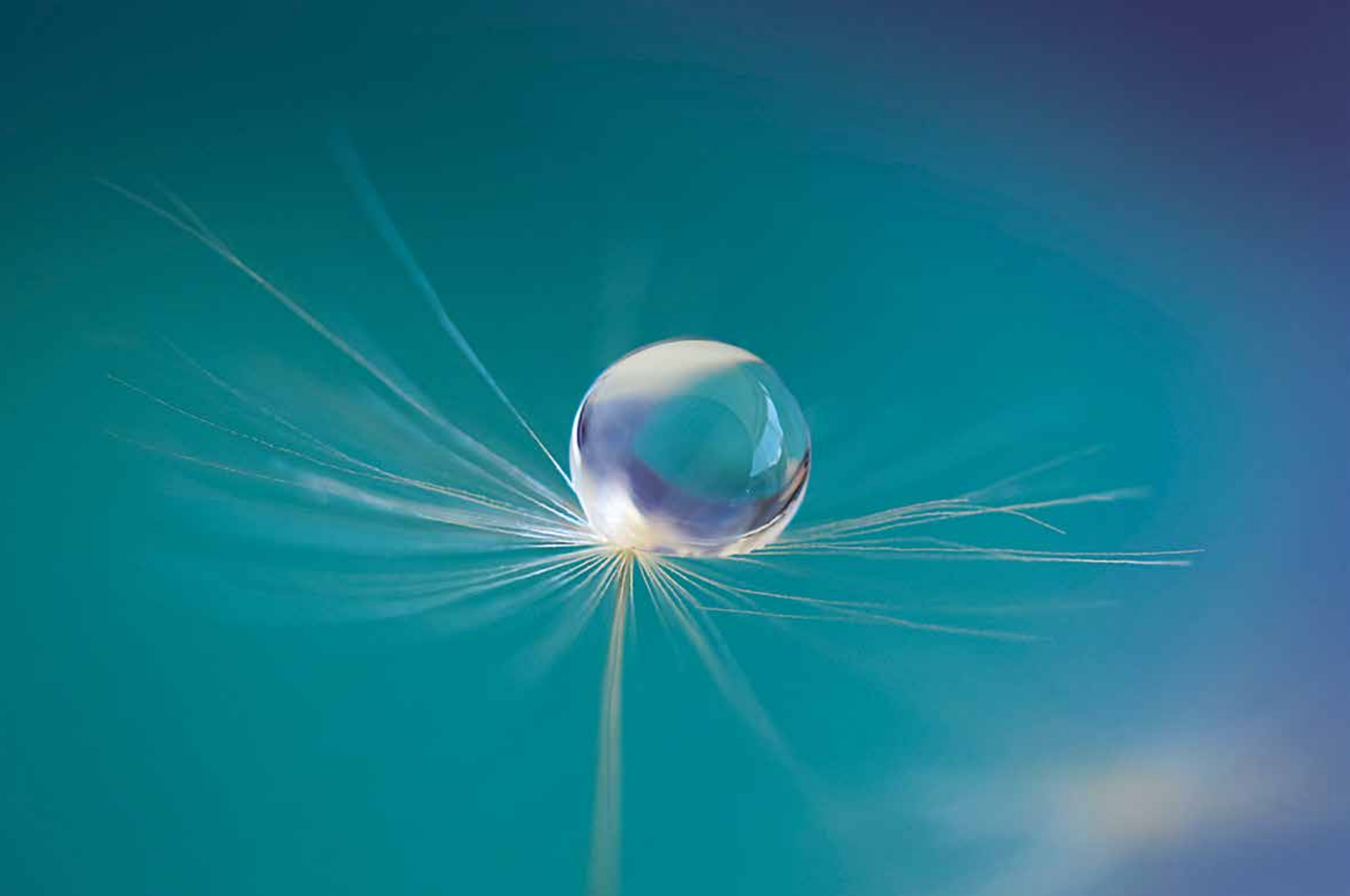
Nådendal. Så liten, men så stark. "Makrofotograferingen öppnade dörren till en annorlunda verklighet. Enligt folksägen blir det en vacker dag ifall maskrosens alla frön lossnar på en gång."