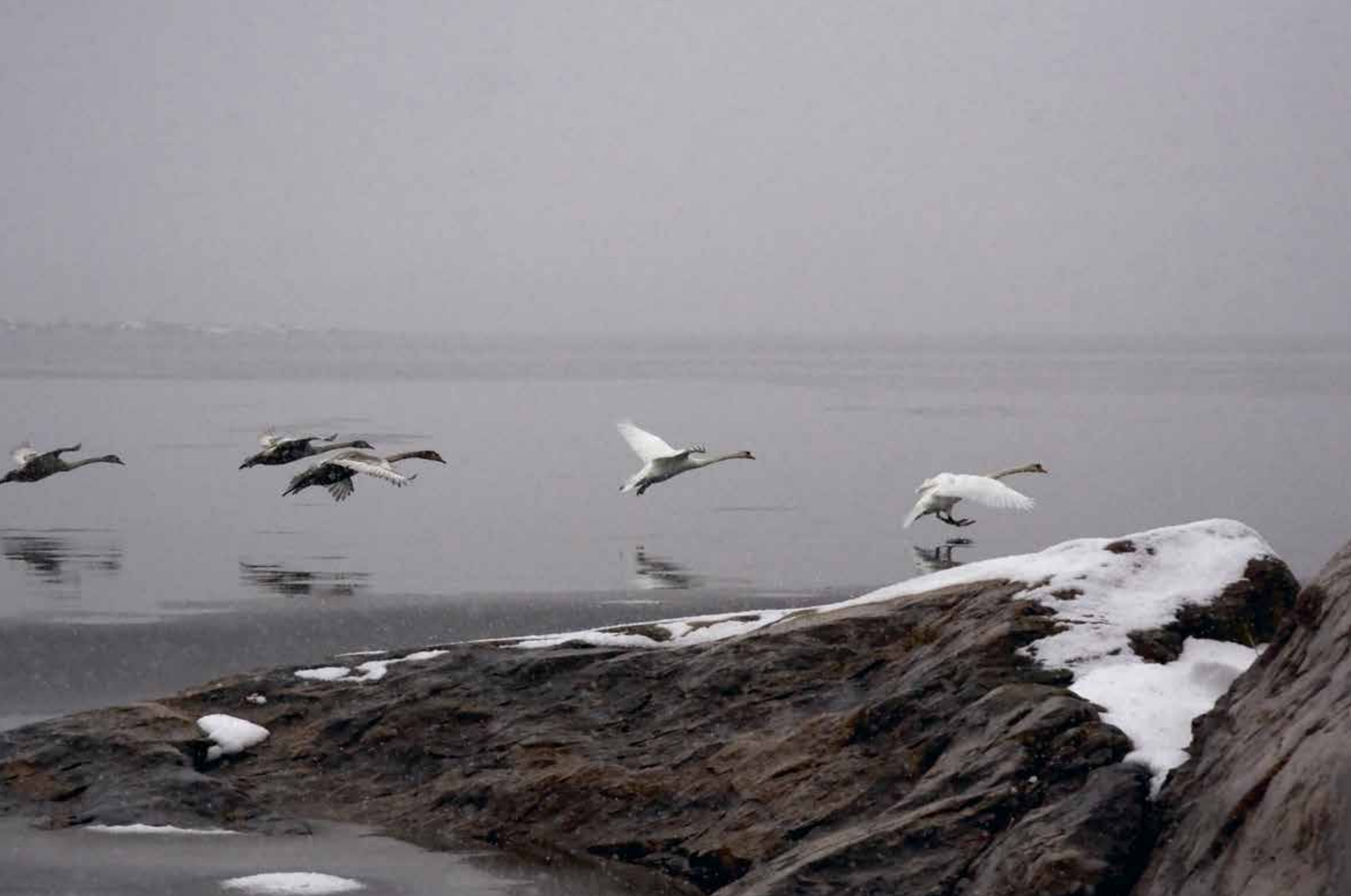
Förby, Finby, Salo. Landing Family. "För mig är naturen finskhetens viktigaste del. Bilden av svanarna som landar är tagen för nästan 10 år sedan."