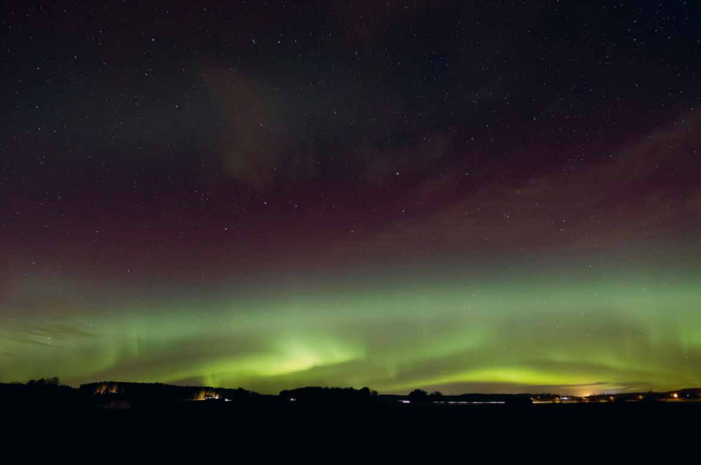
Suomensjärvi, Salo. Norrskenets dans på himlen. ”I slutet av 2018 var det några tillfällen, då man kunde beskåda norrsken även i södra Finland.”