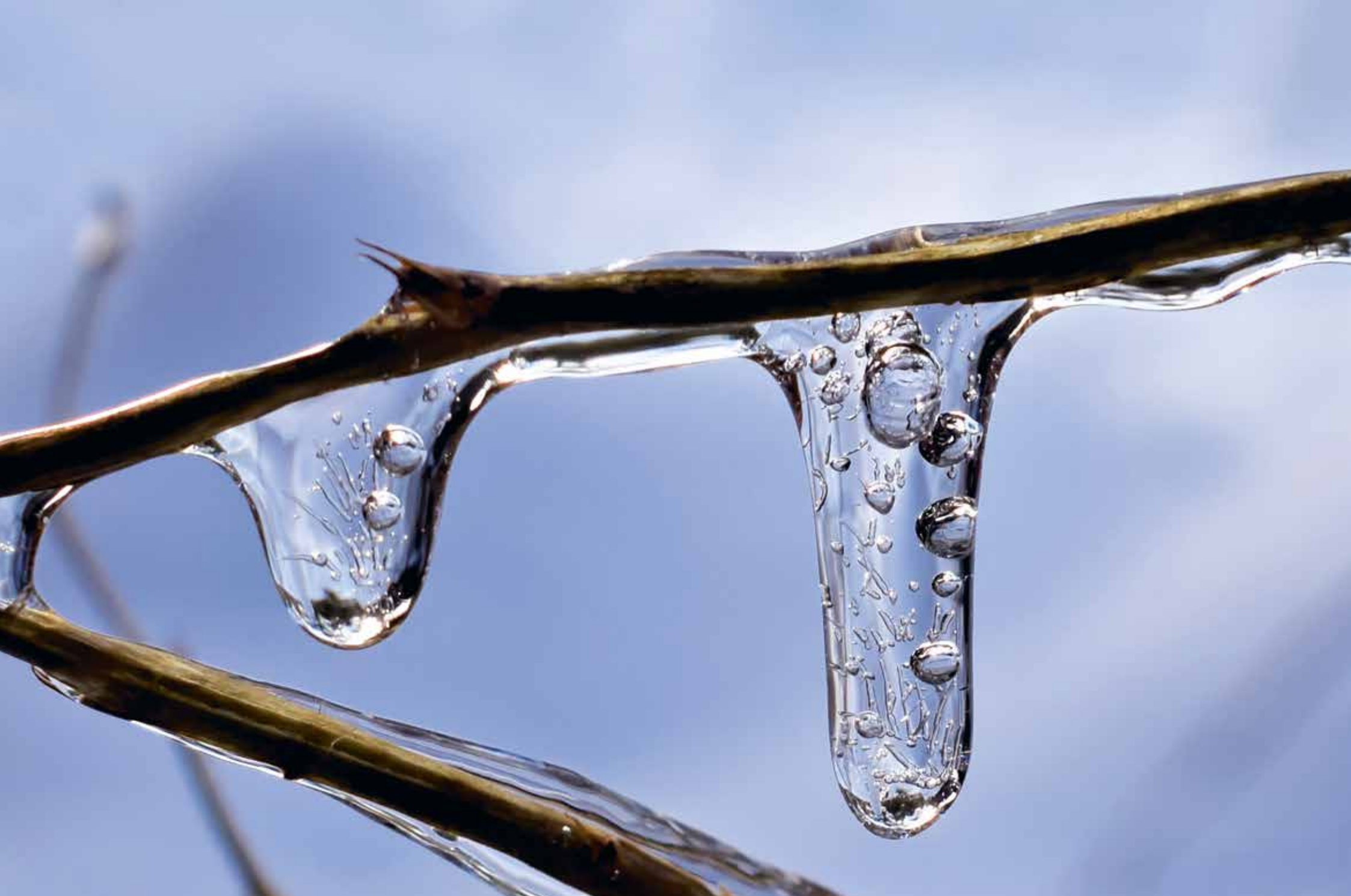
Bild: Kati Hannula. Mietois. Förfrusen tvål. "Vattnet hade glaserat grenarna med is, varenda liten tapp var ett konstverk. Mitt barn utropade att det ser precis ut som om det skulle vara tvål där!"