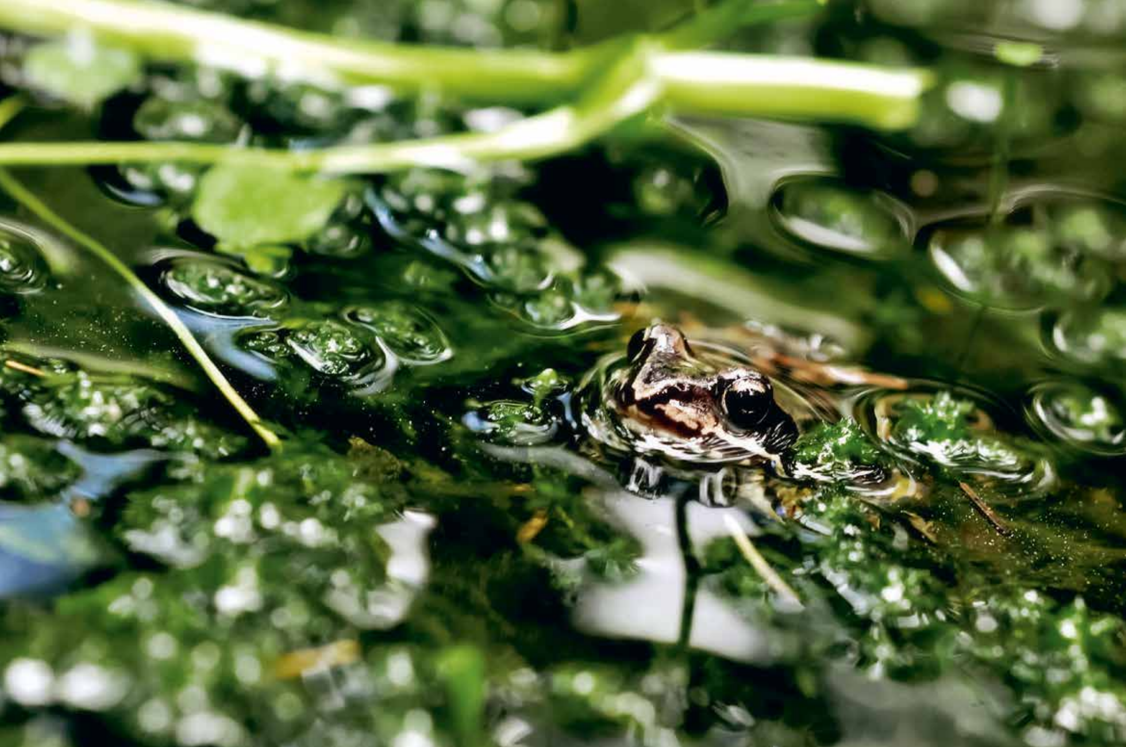
Bild: Selma Obali. S:t Karins. Grodan tittar fram. "Ur skogsdiket i närheten av den hemliga picknickplatsen tittade grodan in i kameran."