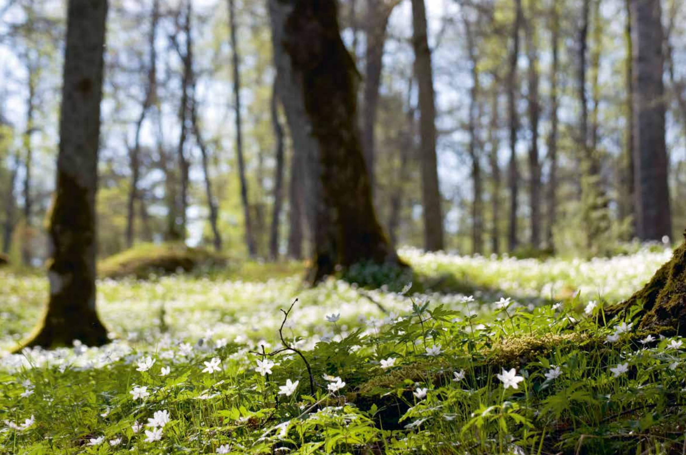
Lenholmens naturskyddsområde, Pargas. Vithet. "En söndag i maj lyste vitsipporna i kapp med solen, utspridda som mattor runt om i skogen."