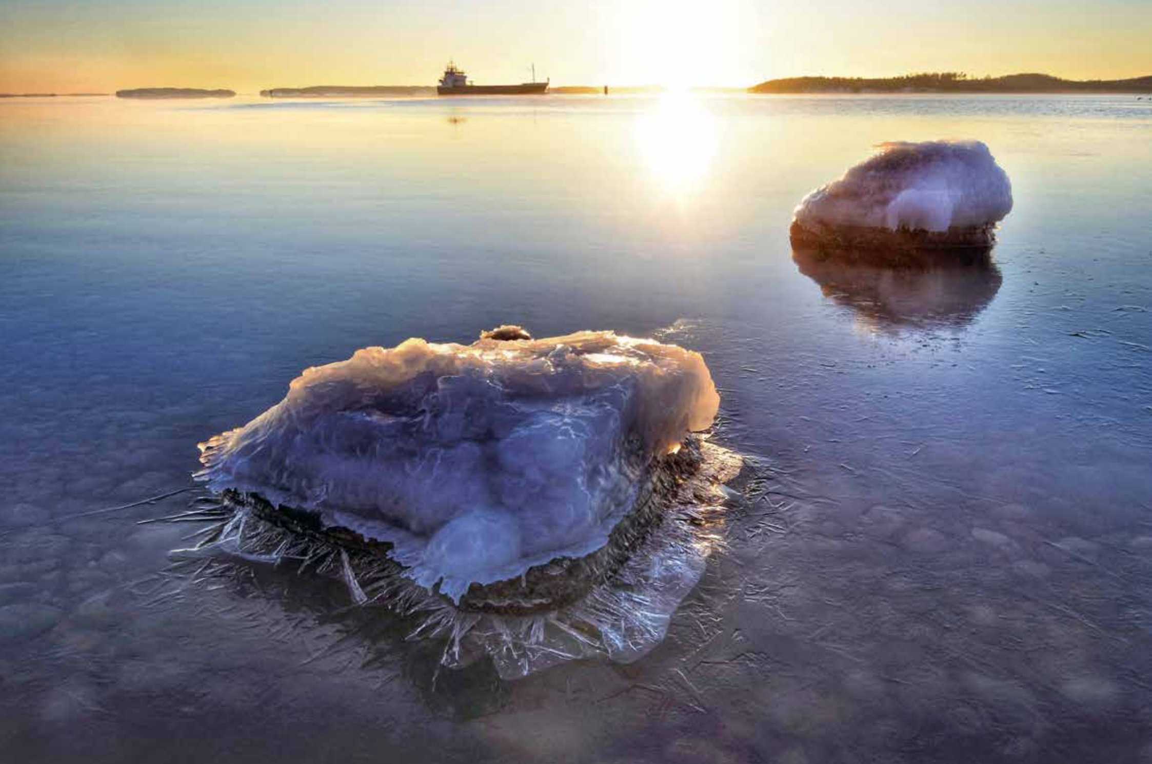
Runsala, Åbo. Isläggning på gång. "En eftermiddag i januari på Kolkka i Runsala. Kölden tilltog och även det strömmande vattnet började frysa"