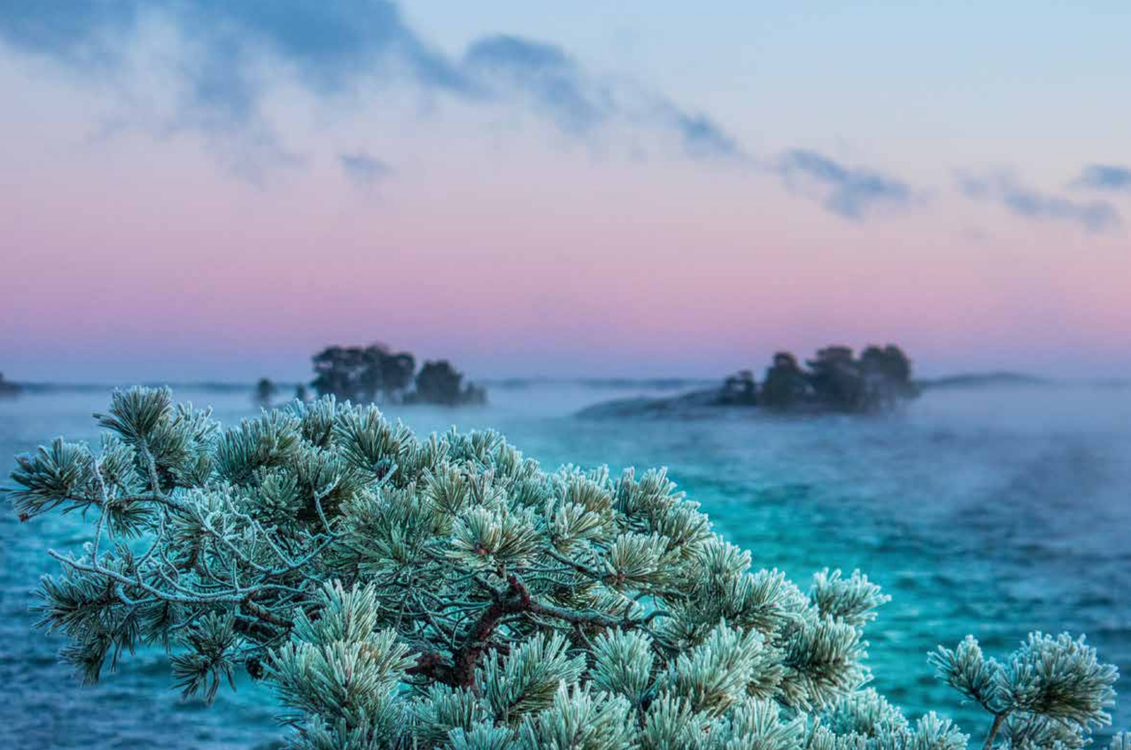
Pargas. Frysande hav. "Havet ryker i den friska nordvästvinden. När bilden togs var det cirka 10 minusgrader."