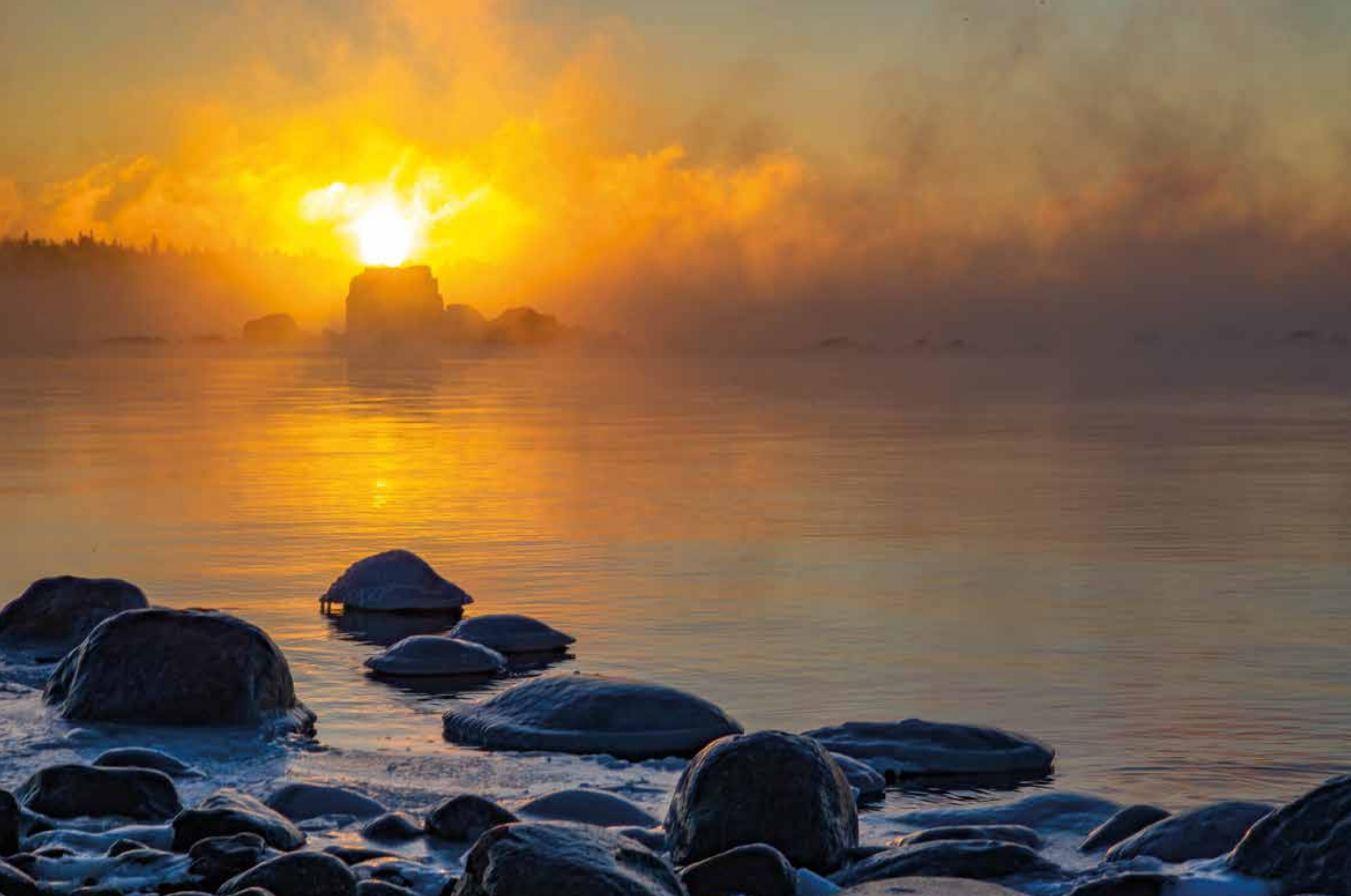
Runsala, Åbo. Soluppgång vid Kolkka udde. ”Jag åkte till Runsala för att fotografera eventuell sjörök. Och det fanns det ju.”