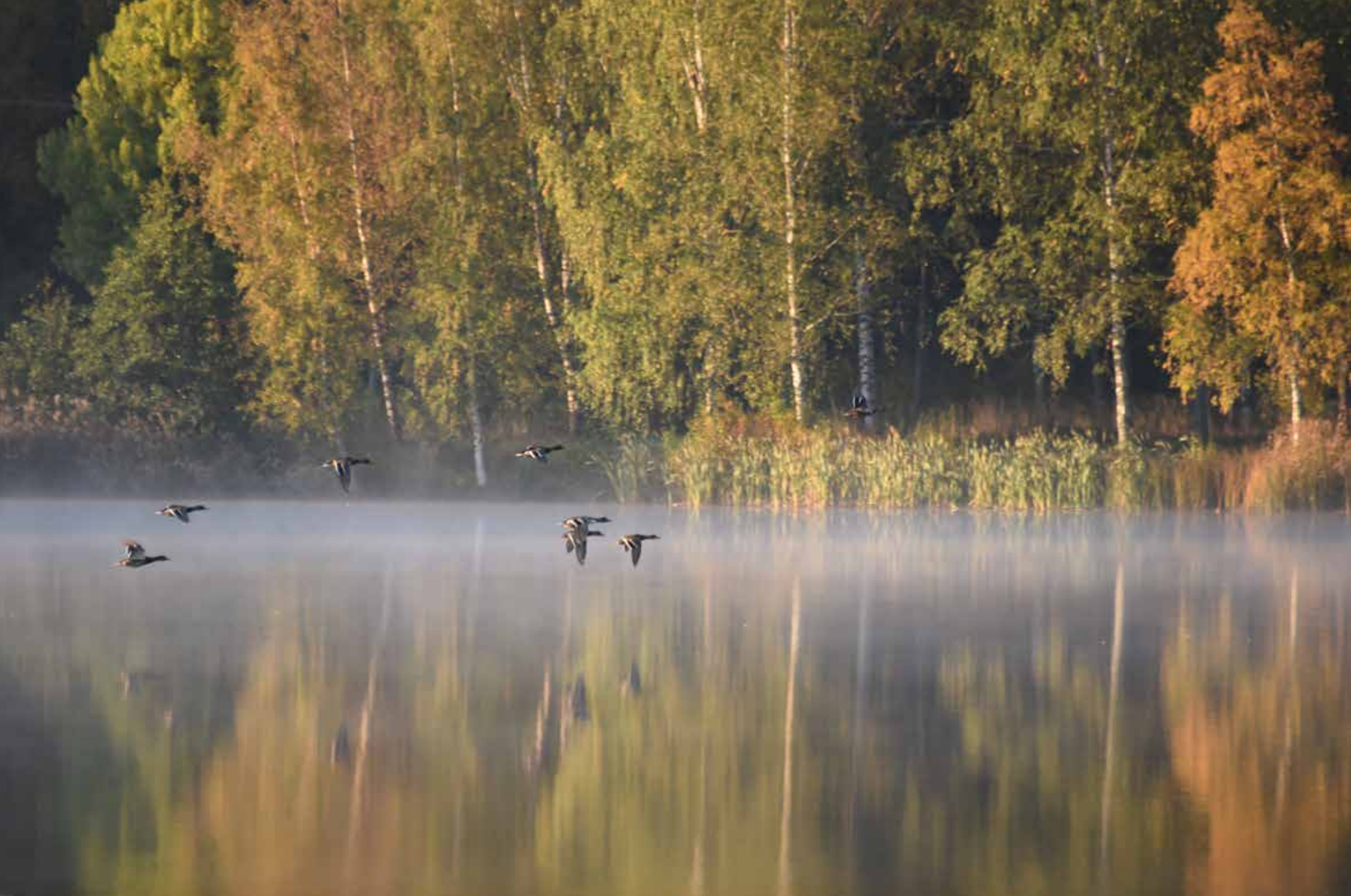
Nystad. Gräsänder och höstfärger. "Höstens färger reflekteras i sjöns yta. Vad fint att jag lyckades fånga både morgondiset och änderna som lyfter."