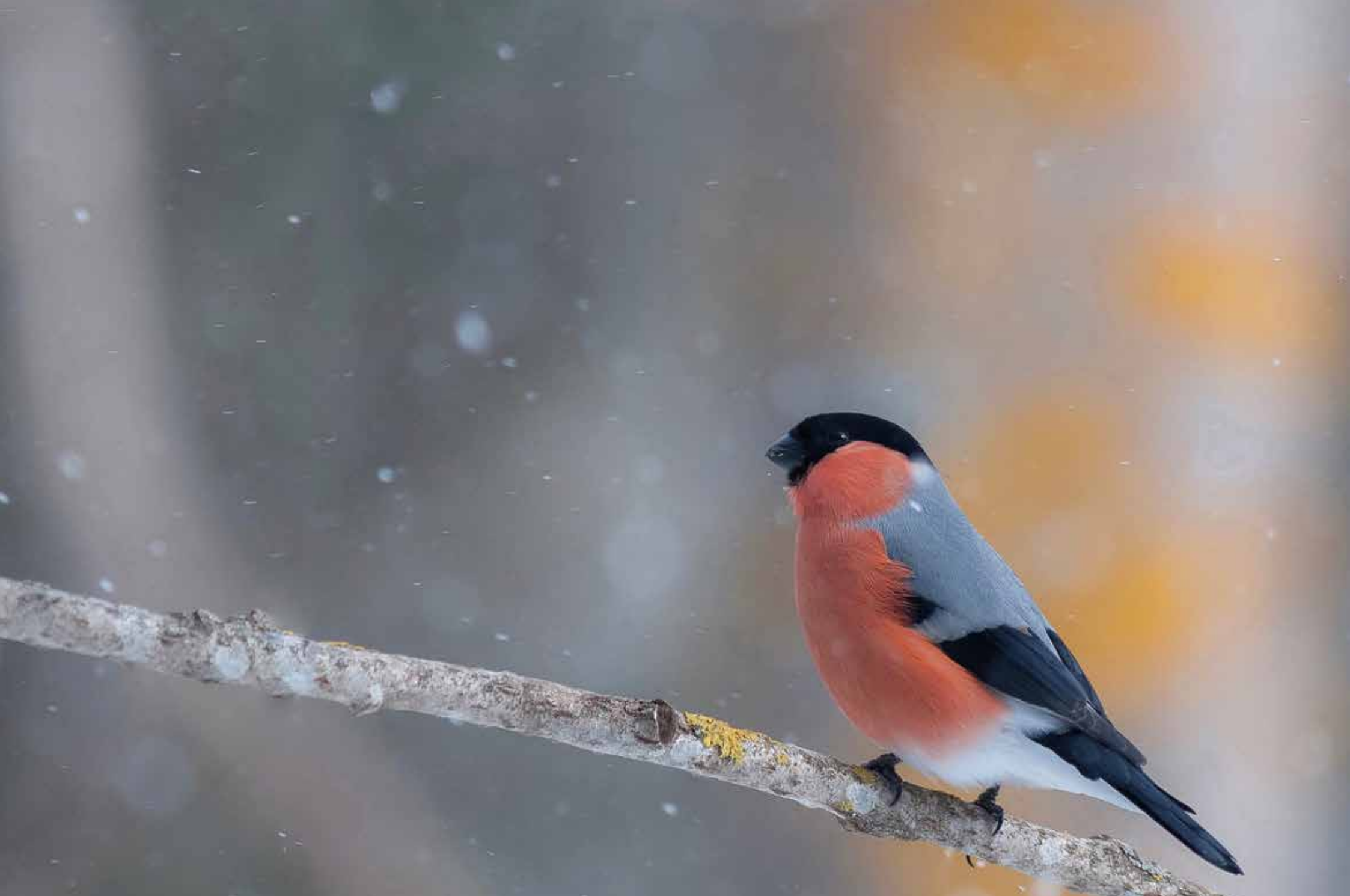
Pöytyä. Domherre. "En riktig ljusglimt i det begynnande snöfallet en kall dag."