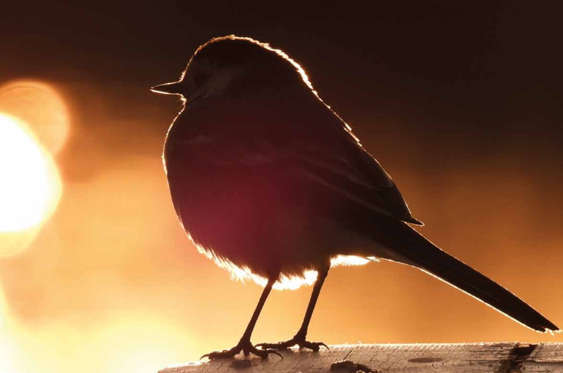
Bild: Tarja Karawatski. Lokalax, Nystad. Förtrollande vår. "Njuter av vårens dofter, ljud och tillväxtens mirakel ensam på stranden, men med sällskap av en sädesärta."