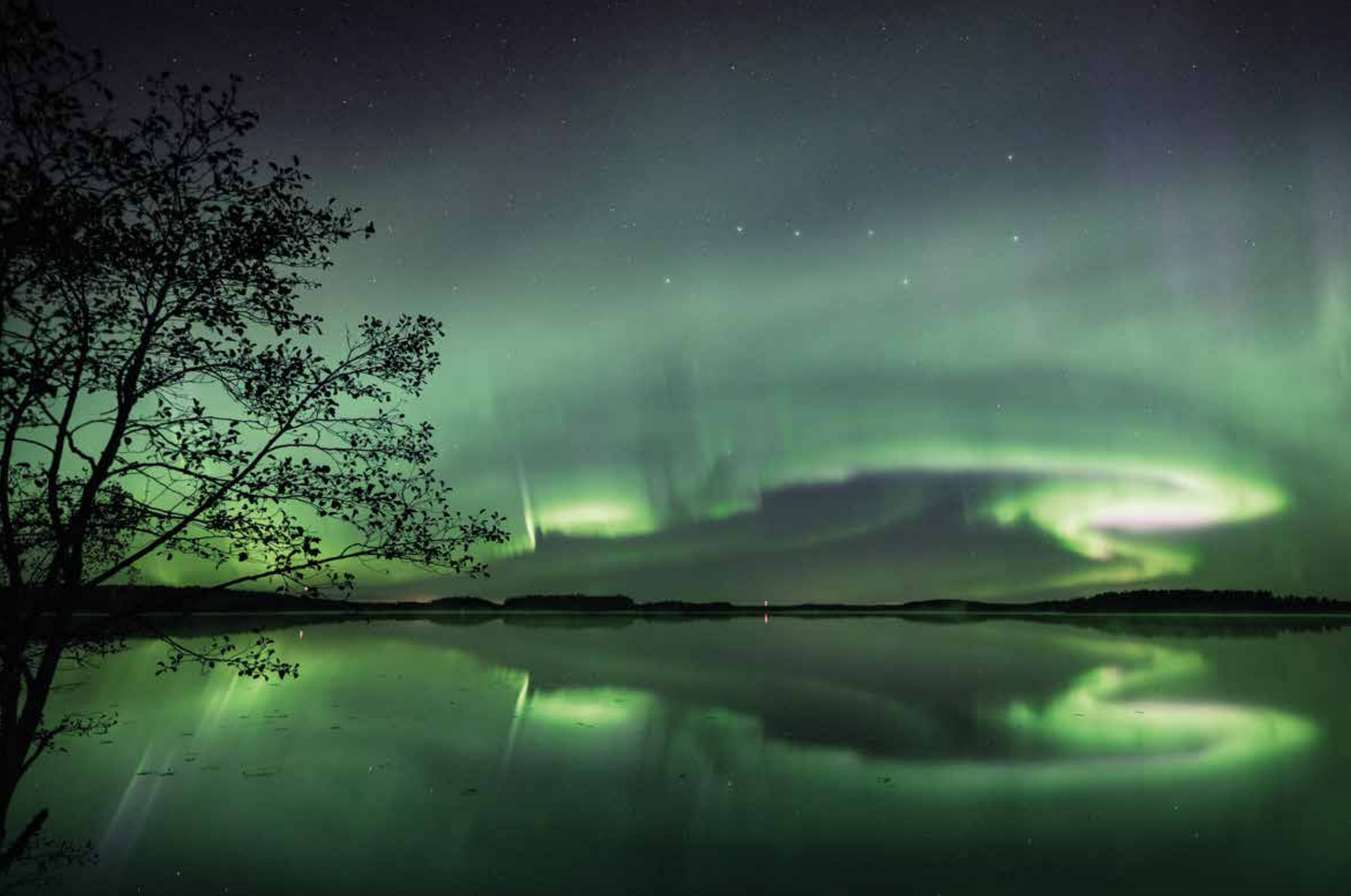
Savonjärvi, Pöytyä. En oförglömlig natt i Kurjenrahka. "Ett ovanligt starkt norrsken fyllde himlen ända i Sydvästra Finland den 7 oktober 2018."