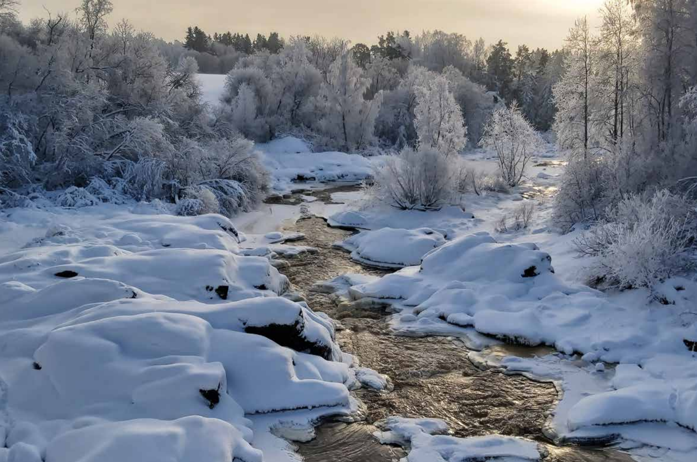
Bild: Eira Lax. Nautelaforsen, Lundo. Frostdagens skönhet. ”Jag älskar vinterlandskap, och framför allt snöiga. Då har jag ofta kameran med mig ute. Den här gången hade jag turen med mig.”