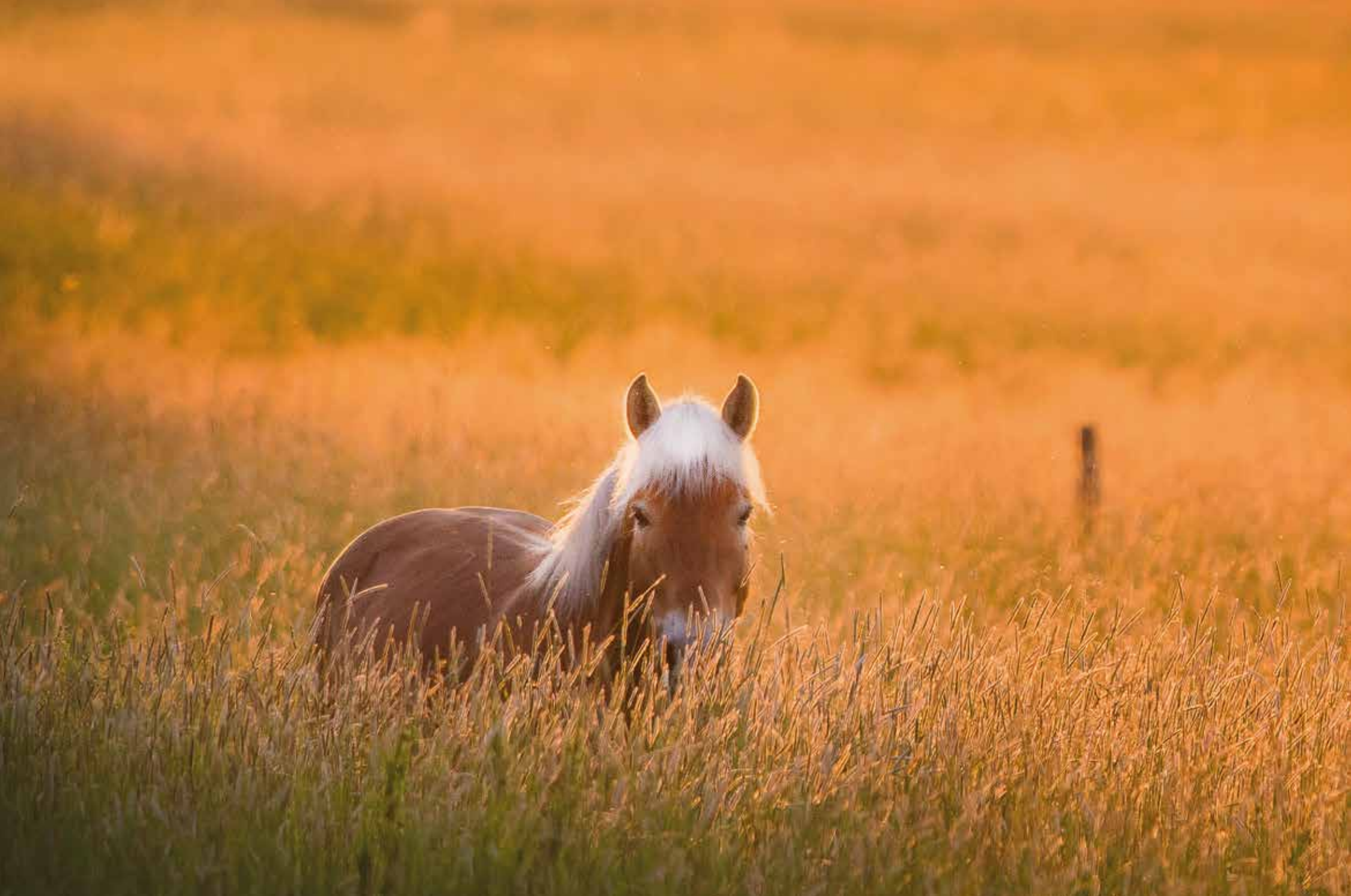
Friskala, Åbo. Gyllene man. "En stilla sommarkväll förgyllde den nedgående solen åkrarna. Bland gräset såg jag en ätande häst, som lojt lyfte på huvudet som för att hälsa på den förbipasserande."