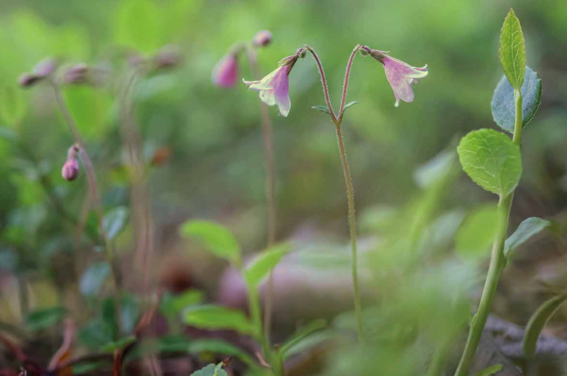
Bild: Jari Stengård. Nagu, Pargas. Sommarnattens sällhet är min. "Blommande linneor i sommarnattens bleka ljus skapar på något sätt en magiskt mystisk stämning. Varje år försöker jag fånga den på bild."